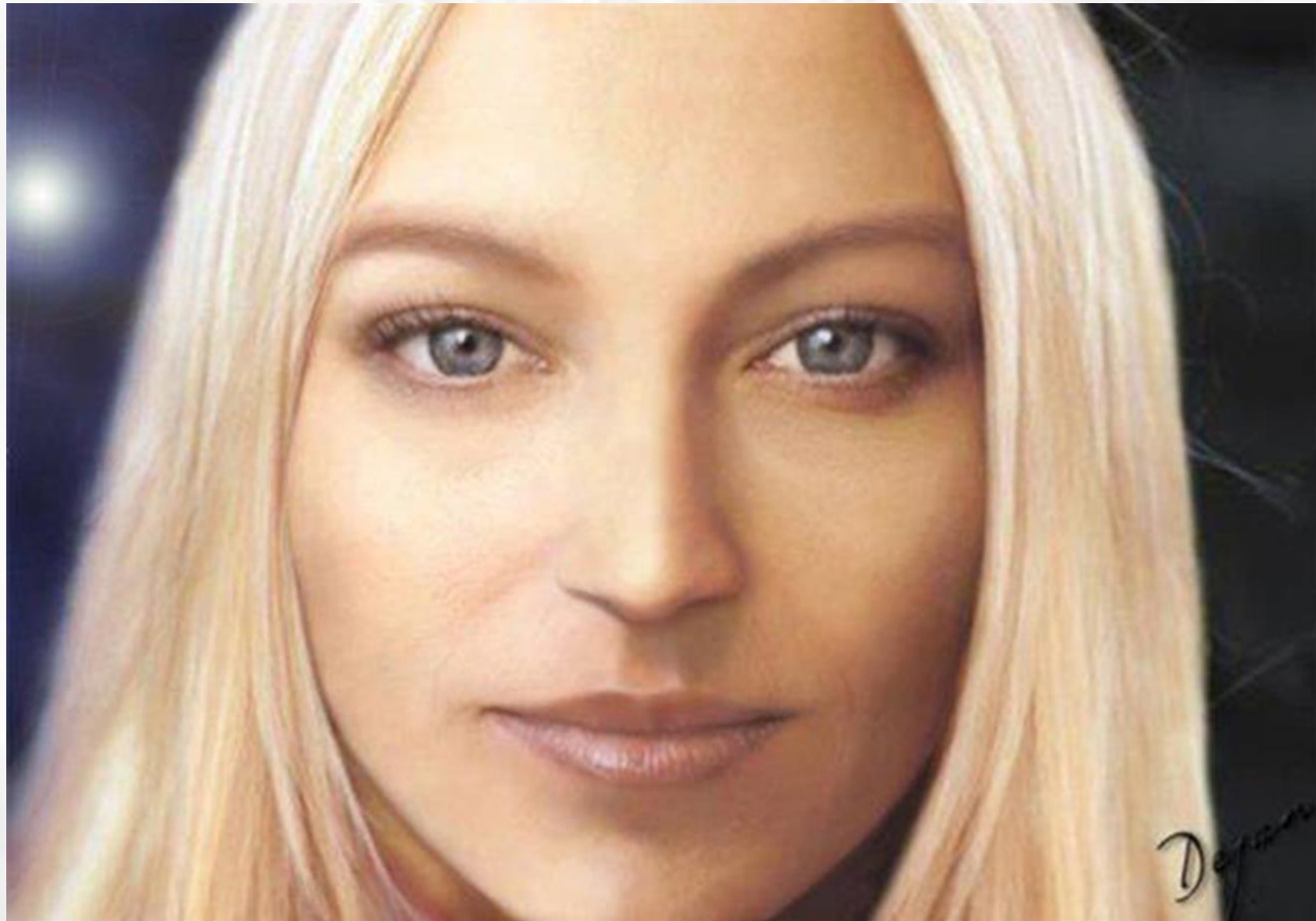
Porträt von Semjase, von Dejan.

https://shop.figu.org/b%C3%BCcher/der-billy-meier-fall-wahr-oder-betrug-the-billy-meier-case-true-or-a-hoax?